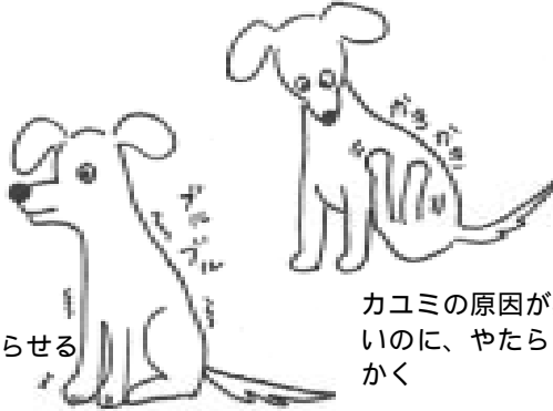
体をこわばらせる 震える