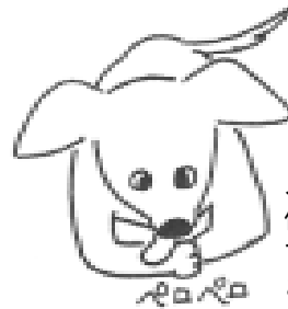
ストレスも慢性化すると... 体の一部をひたすら舐めて、脱毛や皮膚炎を起こすことがある。